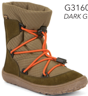
G3160212 DARK GREEN