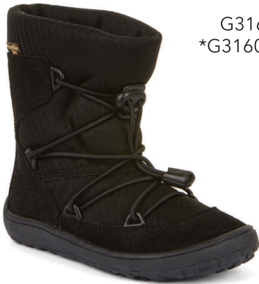
G3160212-8 *G3160212-8A BLACK