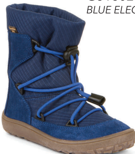
G3160212-3 BLUE ELECTRIC