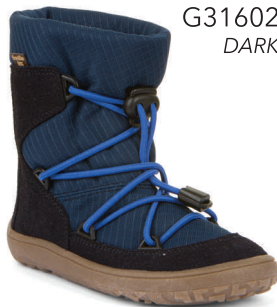
G3160212-1 DARK BLUE