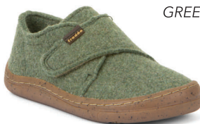
G1700341-5 *G1700341-5A GREEN