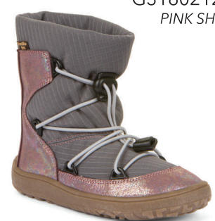
G3160212-7 PINK SHINE