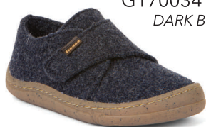
G1700341 *G1700341-A DARK BLUE