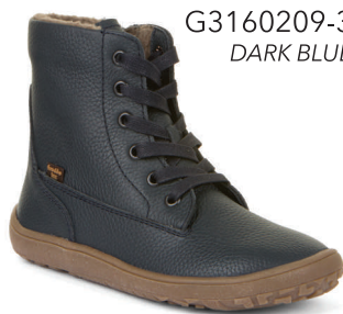
G3160209-3 DARK BLUE