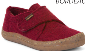
G1700341-8 *G1700341-8A BORDEAUX