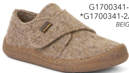
G1700341-2 *G1700341-2A BEIGE