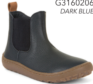
G3160206 DARK BLUE