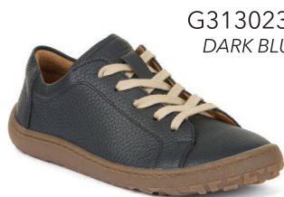
G3130231 DARK BLUE